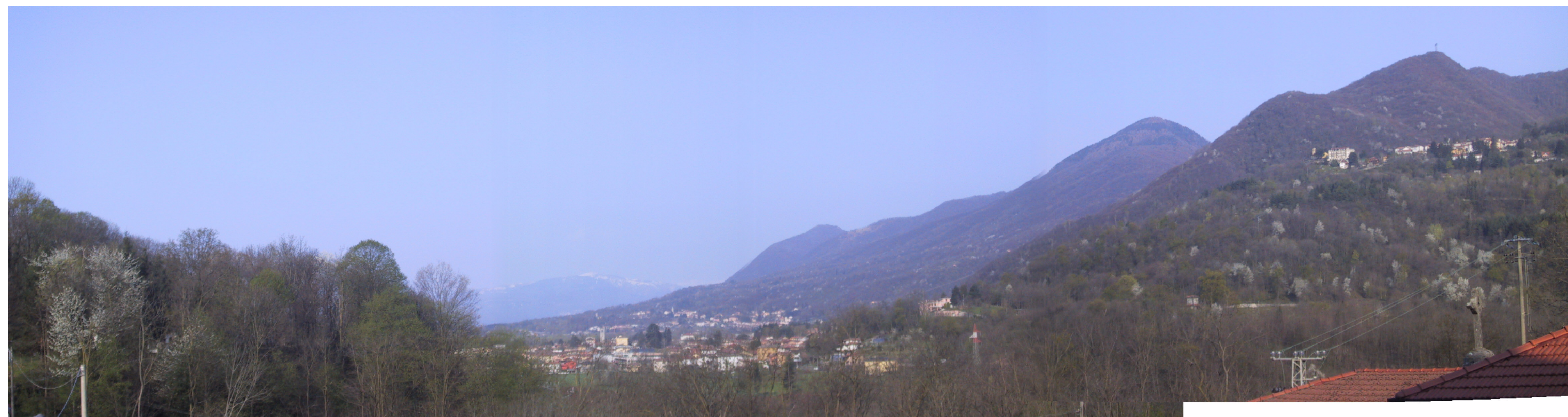
. Foto 5 - Località Cavona - Vista verso l'abitato di Cuveglio